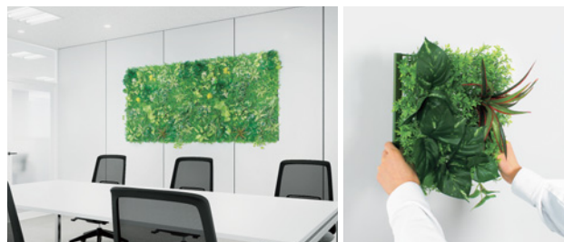
壁面(スチール面) マグネットグリーン

壁面にグリーンを敷き詰める壁面緑化のスタイル。大壁面での演出が可能で、インパクトと癒し効果の高い演出ができる。空間の見せ場作りに最適。