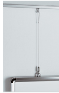
壁付けの代わりにワイヤー吊りする場合