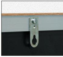
金具を内側にして引掛ける場合