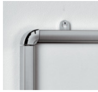
金具を上側に出して、正面からビス止めする場合