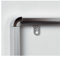
※説明のため裏板をはずしています。 ※裏板のはずれない商品もあります。