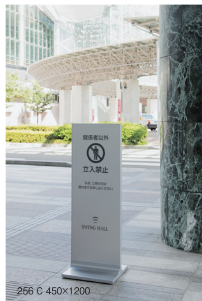
256 C 450×1200