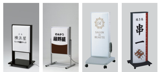
FE464 K FE460 C FE450Z C FE459Z K

FE464・FE460 →P.259 FE450Z →P.260 FE459Z →P.261