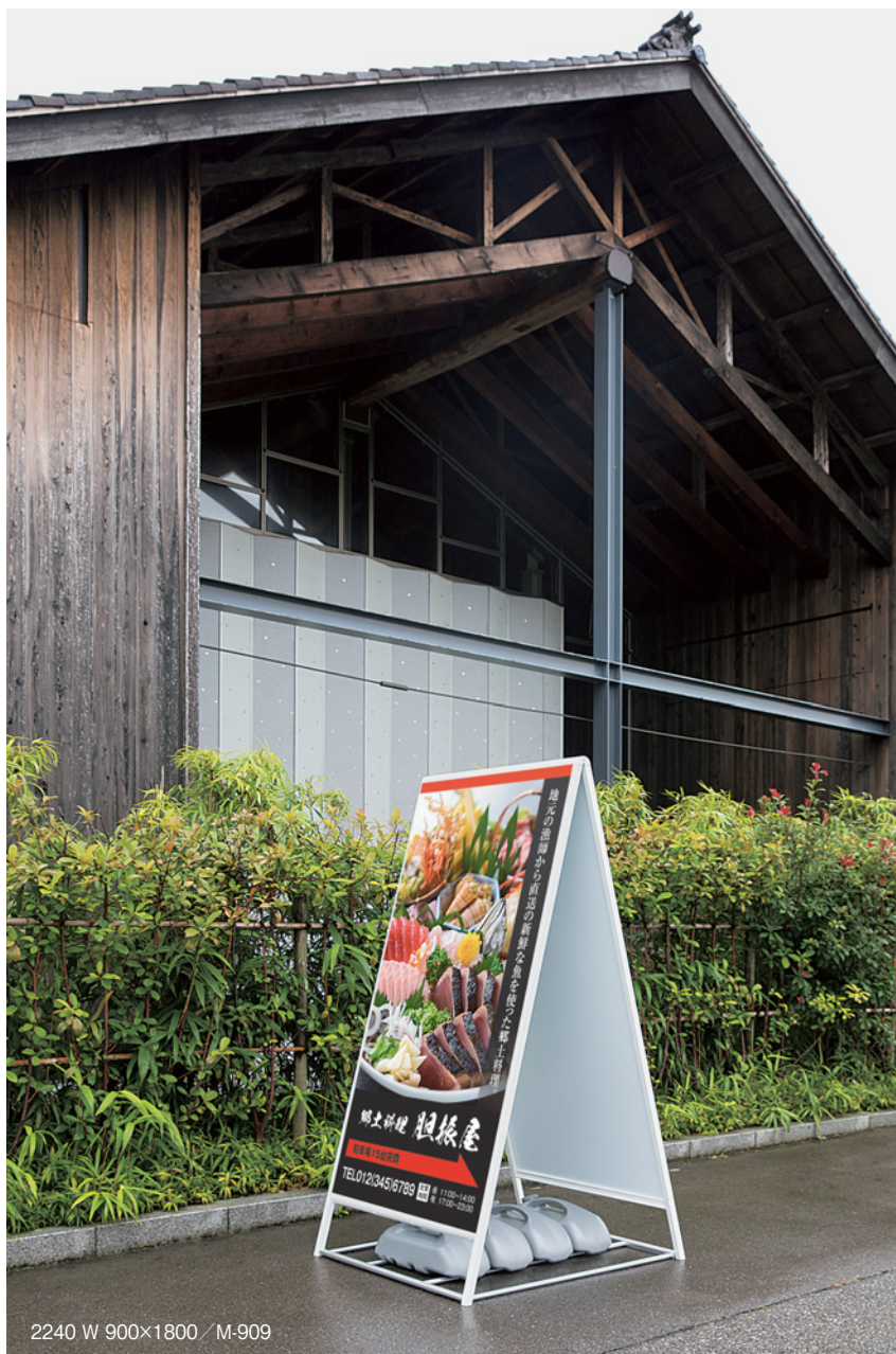
2240 W 900×1800 / M-909

お客様のキャッチ・集客から入店促進に役立つスタンド看板。新しいスタイルとしてデザイン的にオシャレなものを揃えました。お好みのタイプをお選びください。電飾スタンドの最大の目的は、お客様もキャッチすること。さまざまな状況を考えて、キャッチ効果のある看板を揃えました。店名看板を中心としたベーシックな電飾スタンドは、お店に合わせて選べるバリエーションが魅力。グラフィックが引き立つように、面板をできる限り大きくしました。