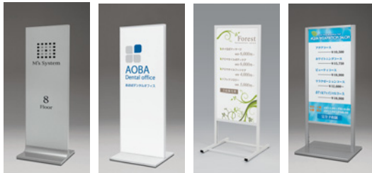
256 C 258 W 244 W 260 C

256 →P.243 258 →P.244 244 →P.245 260 →P.246