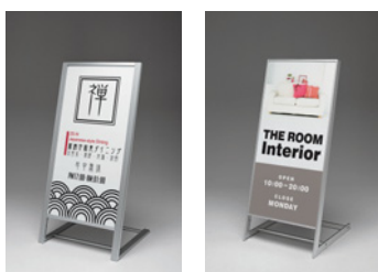
264 C 263 C