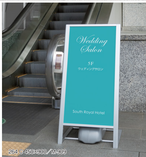
264 C 450×900 / M-909