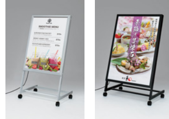
FE478 S FE478 K