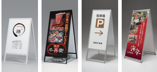
240 W 2240 K 299 C 241 C

240 →P.238 2240 →P.240 299 →P.241 241 →P.242