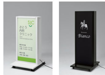
FE467 W FE467 K