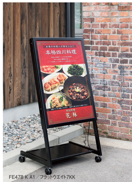
FE478 K A1 / フラットウエイ7KK