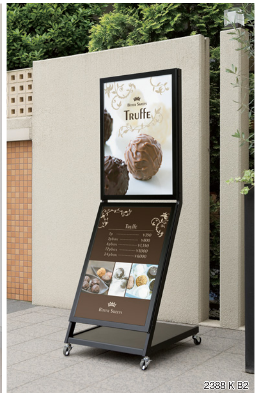
2388 K B2