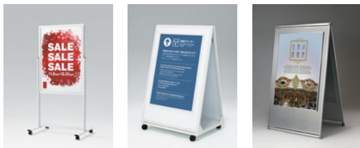
2381 W 2393 W 271 C