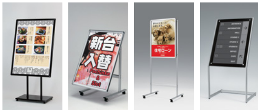
2383 K 291 S 292 S 2385 K

2383 291 292 2385 →P.162 →P.164 →P.165 →P.166