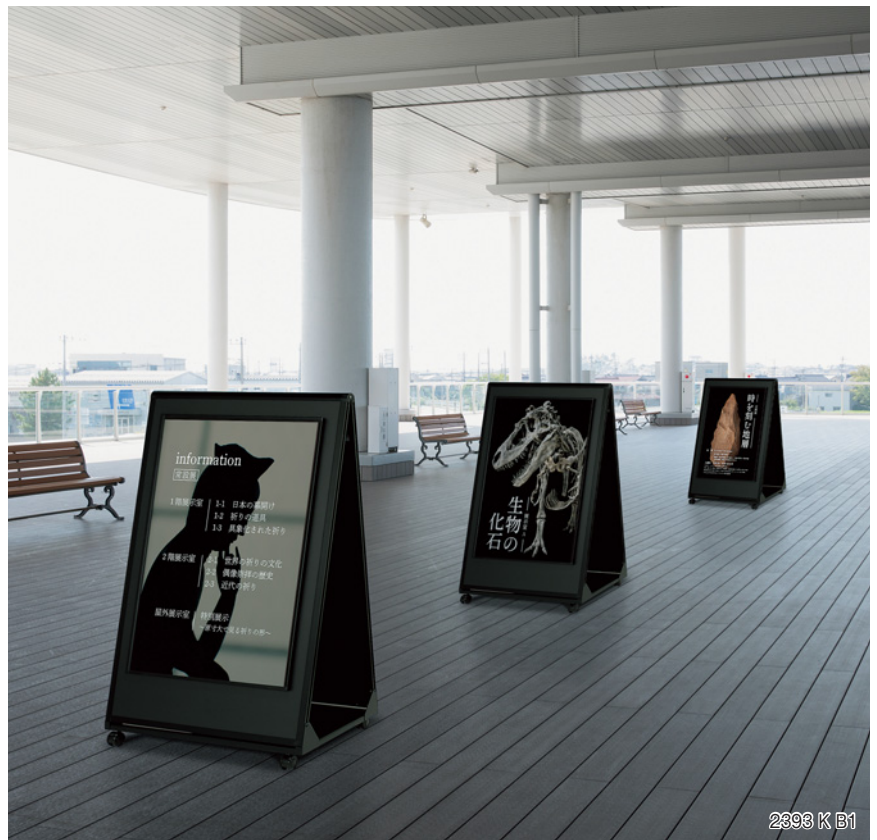
2393 K B1