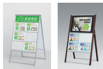
2605 C 2607 SP