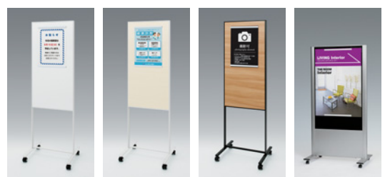
2617 W 2618 W 2618 K 2601 C