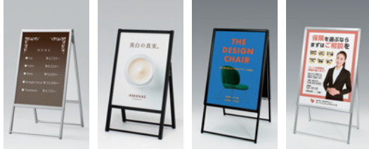
2874 C 2802 K 2884 K 2881 C

2874 2803 2801 2883 2881 2873 2804 2802 2884 2882 →P.156・157 →P.158 →P.159 →P.160 →P.161