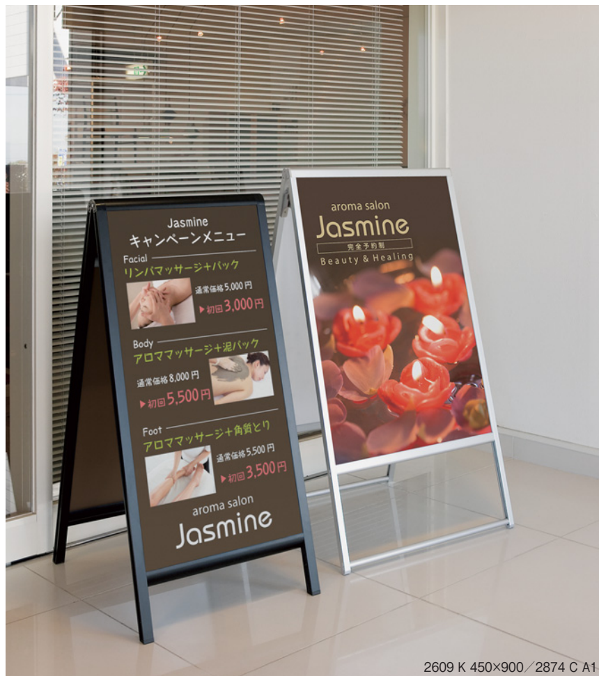
2609 K 450×900 / 2874 C A1