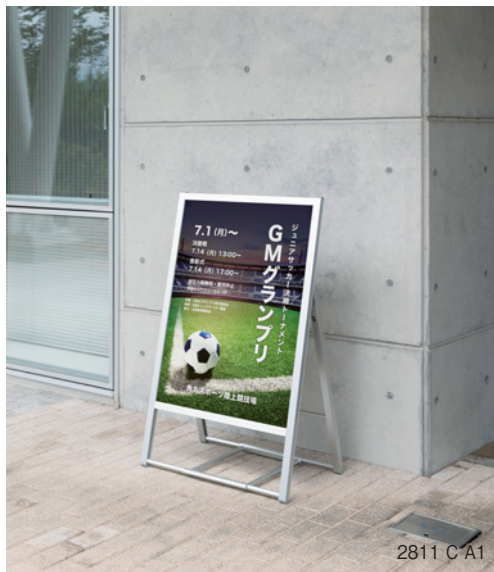
2811 C A1

直立のT型、A型、傾斜、屋外用など設置場所や用途を考慮し、スタイル、サイズ、カラーを取り揃えました。シンプルで上品なデザインが、ポスターやシーンに調和します。ポスターの入れ替えが便利なので、きれいに掲示できタイムリーに情報発信することができます。