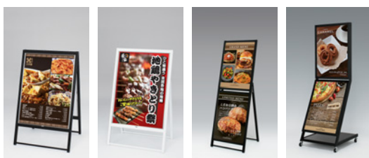
2396 K 2395 W 2816 K 2388 K

2396 2395 2816 2388 →P.170 →P.171 →P.172 →P.173