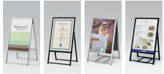
2877 C 2886 K 2813 C 2812 K

2877 2876 2813 2811 2887 2886 2814 2812 →P.174 →P.175 →P.176 →P.177